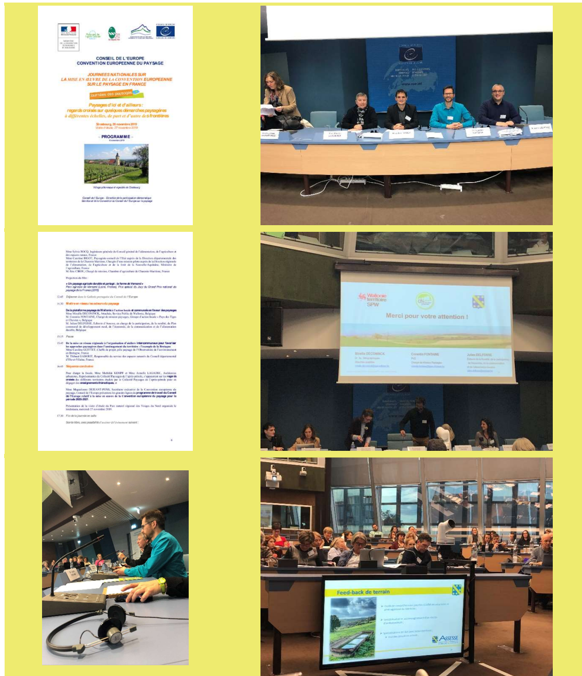
Figure 4 Extrait du programme des journées nationales du Conseil de l'Europe et photos de la participation au Journées d'étude sur la mise en Oeuvre de la convention sur les Paysages du Conseil de l'Europe, Strasbourg 26 novembre 2019

Ce semestre, le GAL « Pays des Tiges et Chavées » a été sollicité par le Conseil de l'Europe pour intervenir dans le cadre des « journées nationales sur la mise en œuvre de la convention européenne sur le paysage en France » à Strasbourg, le 26 novembre 2019.