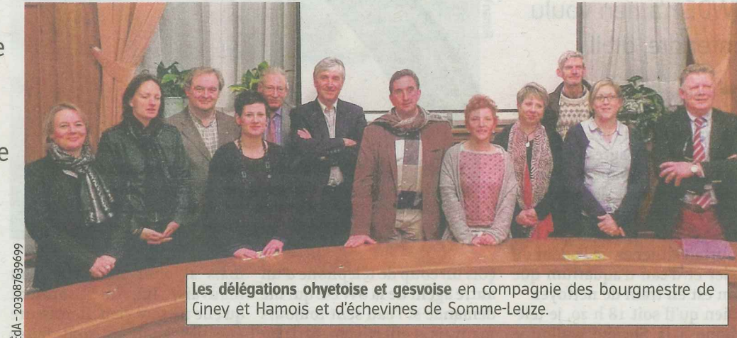
Les délégations oheytoise et gesvoise en compagnie des bourgmestres de Ciney et Hamois et d'échevins de Somme-Leuze.