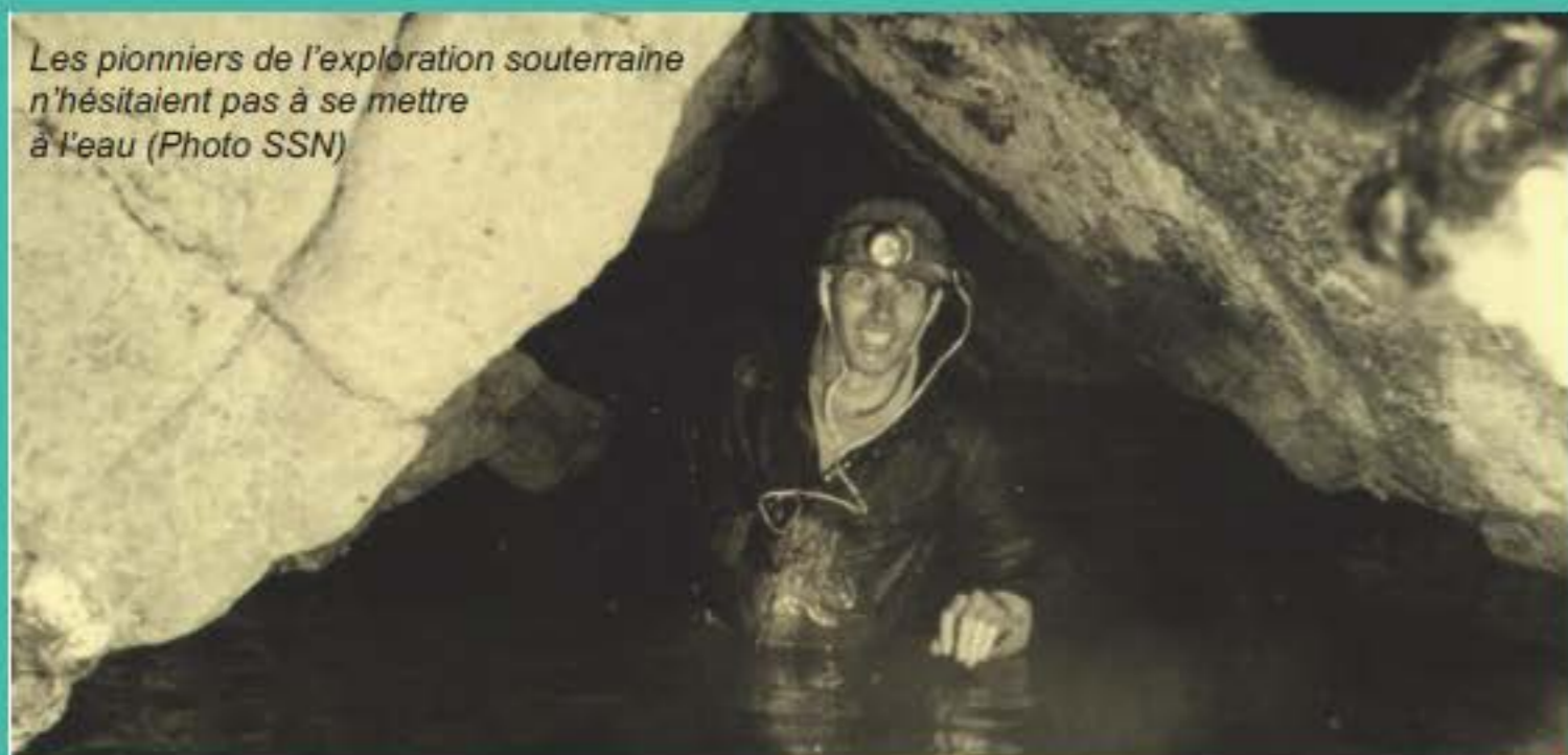
Les pionniers de l'exploration souterraine n'hésitaient pas à se mettre à l'eau