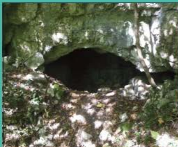
Plongez-vous dans cet ouvrage... comme sous ce porche de la vallée du Samson.

Ces 380 pages donnent une foule de renseignements originaux sur la "face cachée" du Bocq et du Samson, invitant à partir à la découverte d'une des plus belles régions de Wallonie.