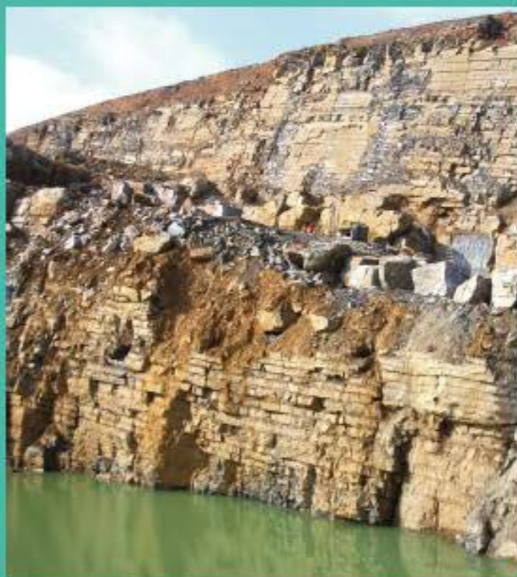
Carrière de calcaire à Durnal (formation de Landelies) - nappe affleurante